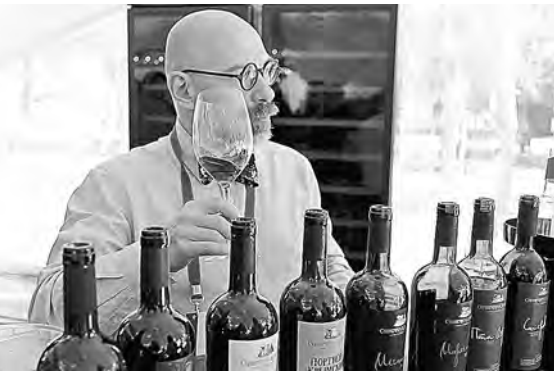
Цель мероприятия — поддержка и популяризация вина, произведенного из местного винограда.

В трех курортных городах Кубани, Сочи, Анапе и Геленджике, с 25 декабря по 25 января пройдет «Неделя вина Краснодарского края». Акция организована в рамках мероприятий по поддержке и популяризации вина, произведенного из местного винограда. Продюцию представят в двух номинациях — напитки, впервые вышедшие на рынок, и товар, продаваемый по специальным ценам и со специальной символикой. Партнерами акции, приуроченной к зимнему курортному сезону, станут магазины федеральных и локальных розничных сетей, рестораны и кафе. Участникам «Недели» предложат скидки, тематические гастрономические ужины и дегустации.