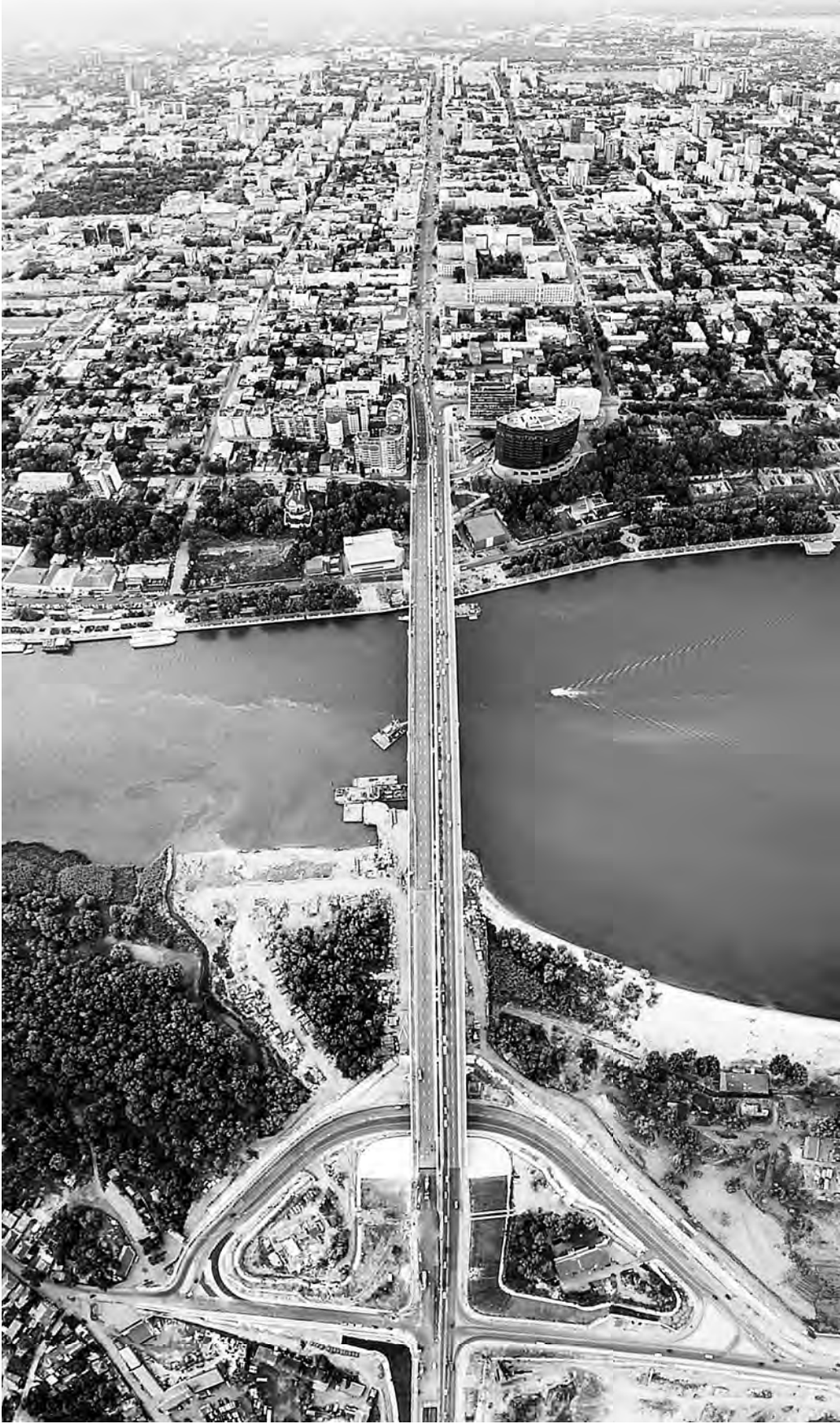
Новые дороги и магистрали — это как движение вверх: поднимает экономику и делает жизнь людей комфортнее.

Авиакомпания из Иркутска планирует открыть из аэропорта Платов международные рейсы в Париж и Ереван, а также несколько внутренних маршрутов, в частности, в Новый Уренгой и Чебоксары. Кстати, за 10 месяцев нынешнего года пассажиропоток аэропорта Платов приблизился к отметке 2,5 миллиона человек, что на 38 процентов больше, чем за аналогичный период минувшего года.