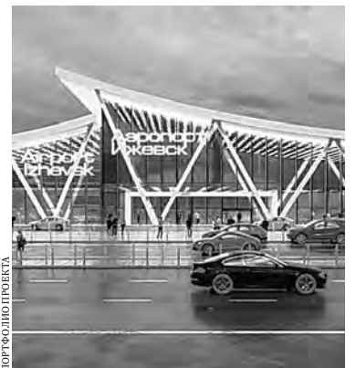
Внешне новый ижевский аэропорт будет крылатым.