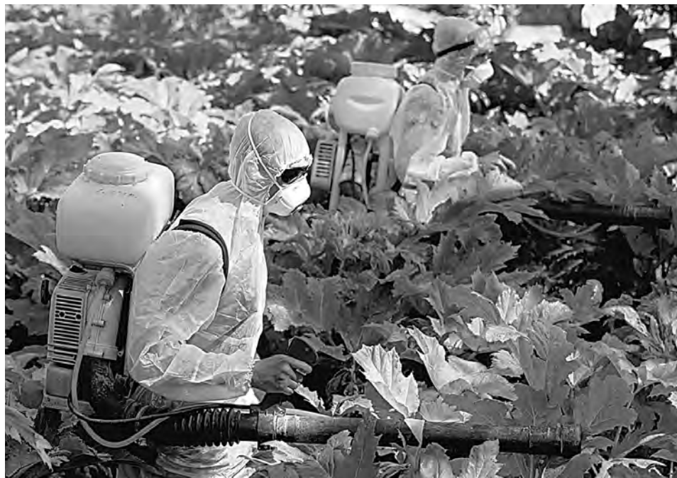
Атака на борщевик Сосновского ведется по всем правилам: цепью с оружием наперевес.

На нескольких экспериментальных участках Харевский травил борщевик химией, косил, выкапывал и даже морозил. Морозы оказались эффективны, но климат меняется, а значит, на холода лучше не рассчитывать.