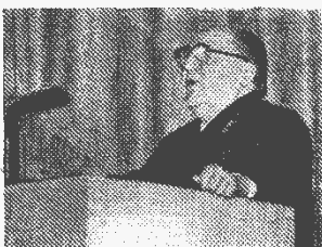
Выступает Р. Руденко