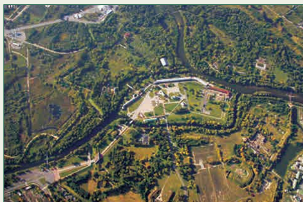
Вид на Брестскую крепость с самолёта ▲

Публикацию подготовил Е.А. БОЧКОВ