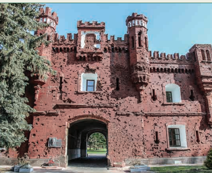
▲ Внешний фасад Холмских ворот цитадели

Мемориальная доска на фасаде Холмских ворот