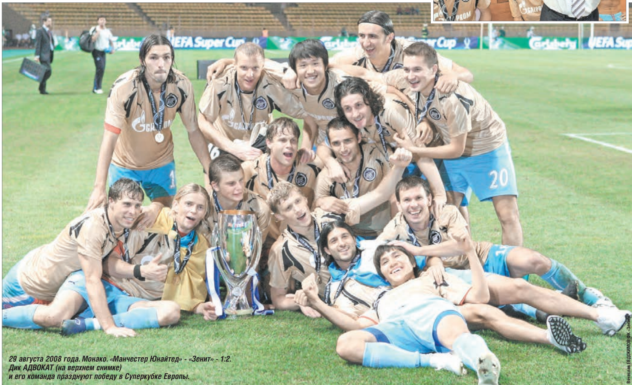
29 августа 2008 года. Монако. «Манчестер Юнайтед» - «Зенит» - 1:2. Дик АДВОКАТ (на верхнем снимке) и его команда празднуют победу в Суперкубке Европы.

29 августа 2008 года «Зенит» стал первым и пока единственным российским клубом, который выиграл Суперкубок Европы, победив «Манчестер Юнайтед» (2:1). Главный тренер того «Зенита» в интервью «СЭ» вспомнил триумф, поделился мнением о команде Сергея Семака и дал прогноз на воскресный матч со «Спартаком».