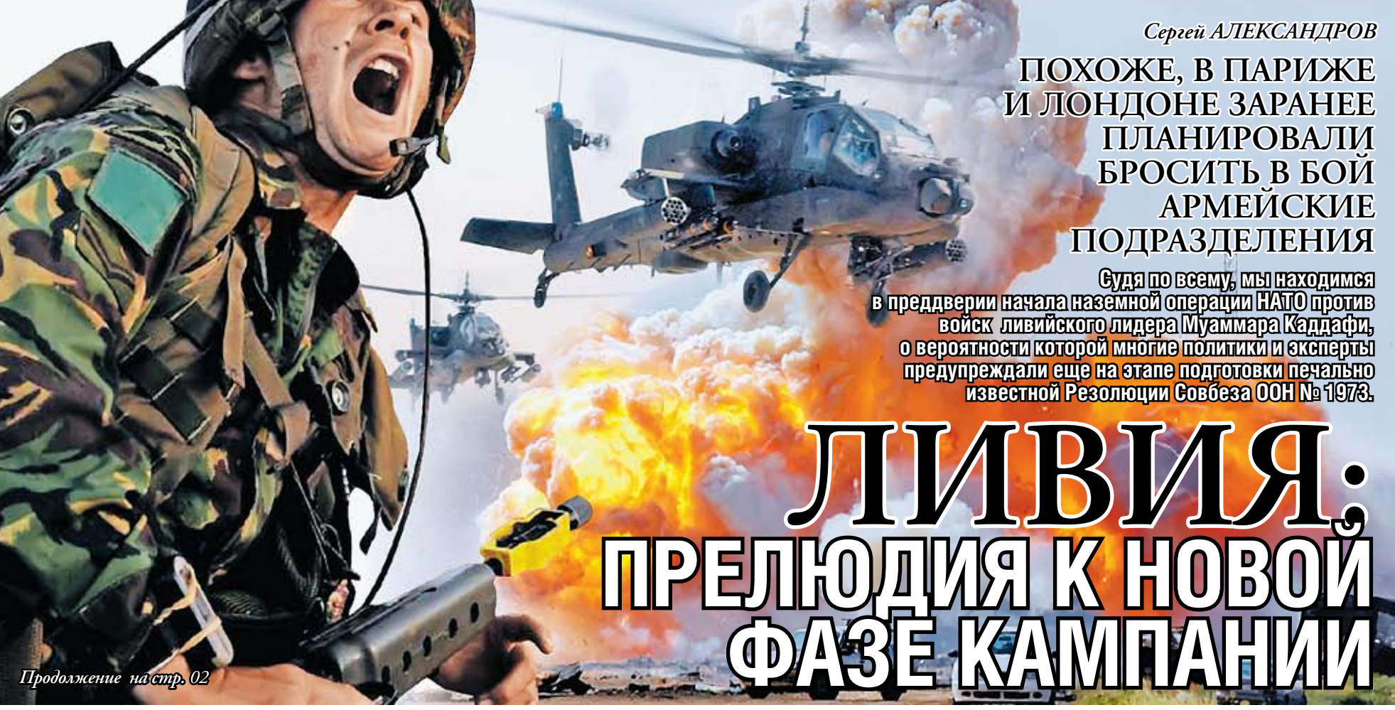
Продолжение на стр. 02

НЕСМОТРЯ НА ПРОТЕСТЫ МОСКВЫ США все равно продолжают создание противоракетной обороны 10