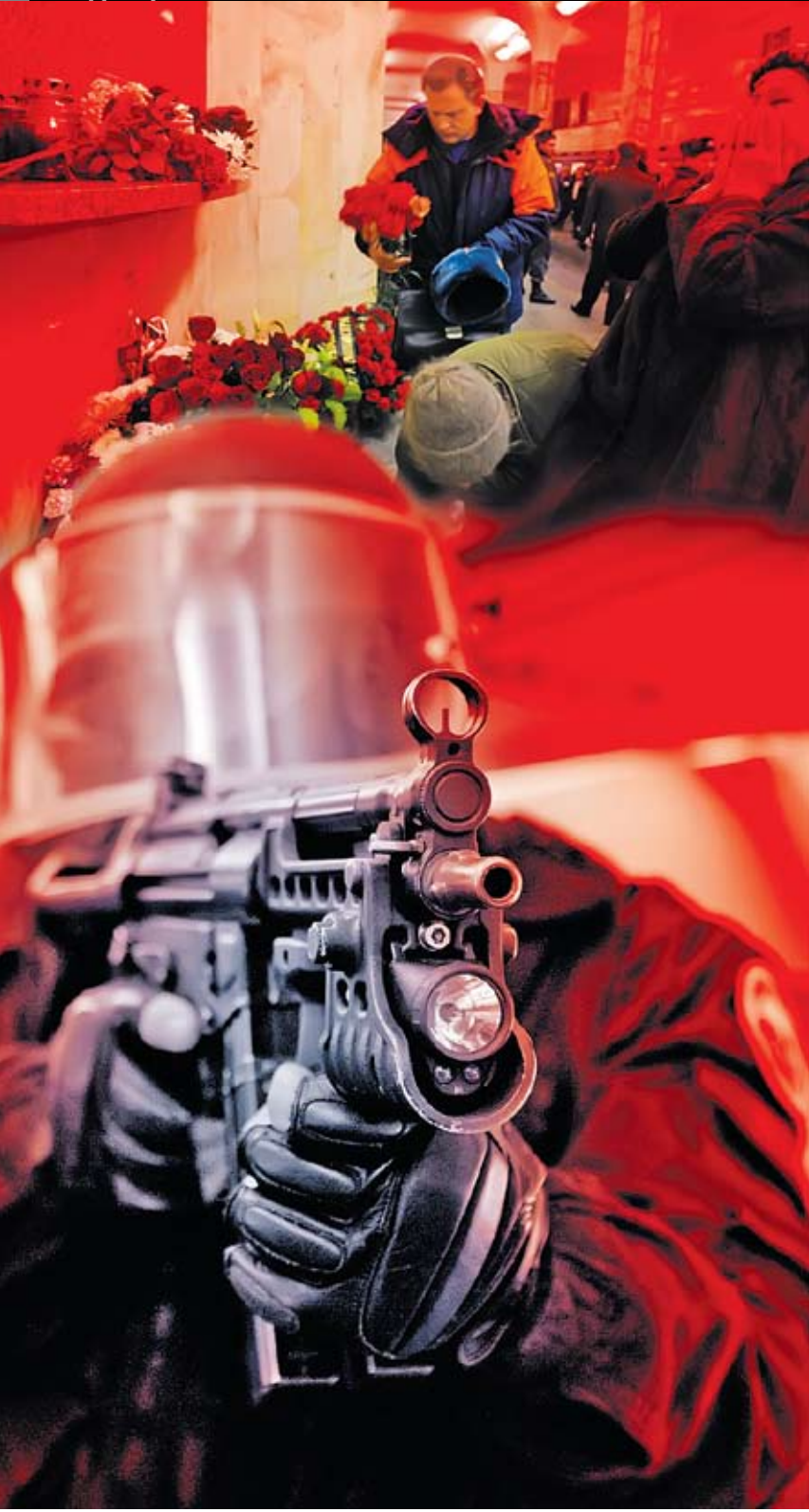
Коллаж Андрея СЕДУХА