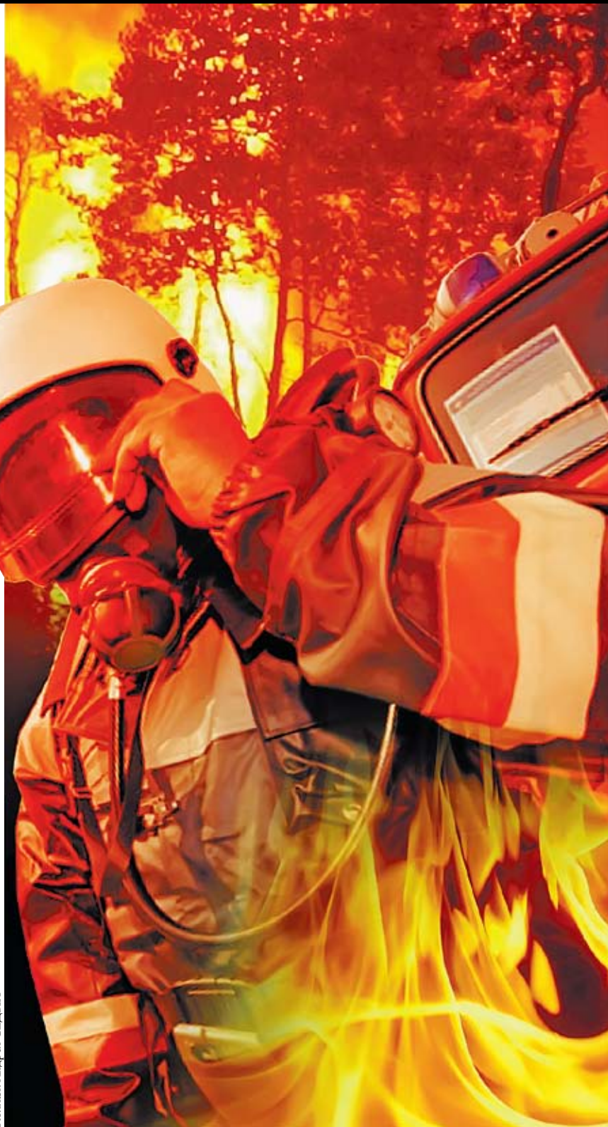
Коллаж Андрея СЕДУХА

В интересах совершенствования механизмов государственного и военного управления в ЧС адмирал Муллен в 2010 году ввел в действие новую серию стратегических КШУ по типу «Кризисное реагирование» и одобрил для доклада президенту США концепцию перспективных межведомственных учений «Национальное кризисное реагирование», которые предполагается проводить начиная с текущего года под общим руководством Совета национальной безопасности.