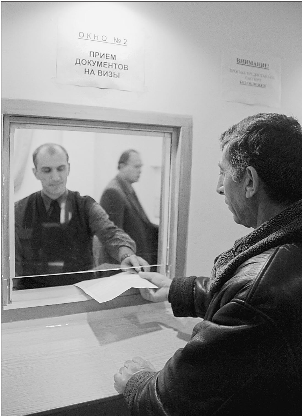
Тбилиси. Безуспешная попытка сдать документы на получение российского гражданства

● ЦИТАТА ДНЯ «У всех у них один недостаток: они — не ты». Александр ВАМПИЛОВ