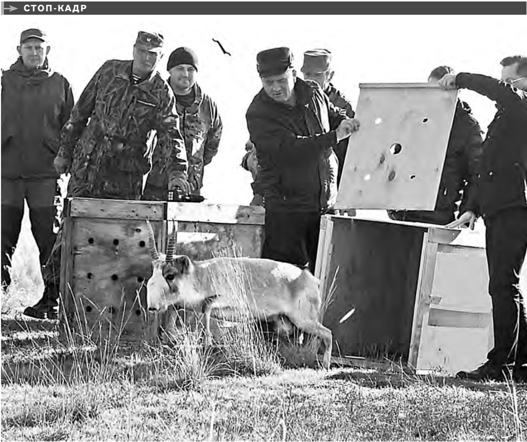
В Астраханской области в природный заказник «Степной» в Лиманском районе выпущены молодые сайгаки. Сейчас здесь построен новый кордон со смотровой вышкой, на территорию заказника запрещен въезд автотранспорта. Кстати, за последние годы в регионе не зафиксировано ни одного случая браконьерства — выживаемость сайгаков в дикой природе составила 100 процентов.

НОВЫЙ стадион «Новоколом-арена» появился в хуторе Абрамовка Каменского района. Современный спортивный объект с искусственным покрытием отвечает стандартам проведения всероссийских детских соревнований. Размеры футбольного поля в игровой зоне — 65 на 45 метров, трибуны на сто мест, раздевалки с душевыми, зеркалами и теплым полом. Всего в этом году на Дону построено более 100 спортивных объектов.