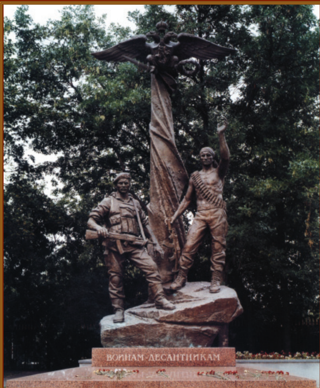
Памятник воинам-десантникам Скульптор Михаил Переяславец, Москва

2 августа — День Воздушно-десантных войск 80 лет со дня образования