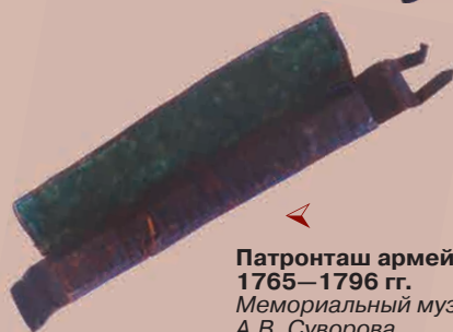
▲ Патронташ армейских пеших егерей 1765—1796 гг. Мемориальный музей А.В. Суворова

Рейтар лейб-гвардии Конного полка в проектных мундирах конца 1780-х гг. Акварельный рисунок неизвестного художника. Российский государственный военно-исторический архив