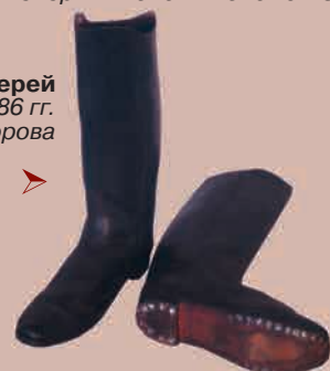
▲ Сапоги армейских пеших егерей 1765—1786 гг. Мемориальный музей А.В. Суворова

В ГОД празднования 220-летнего юбилея Дня воинской славы России — победоносного взятия русскими войсками крепости Измаил Фонд «Русские Витязи» выпустил вторую книгу* из серии «Русский военный костюм», посвящённую истории русского военного мундира, которая охватывает обширный период последней трети XVIII века — славного правления Екатерины II.