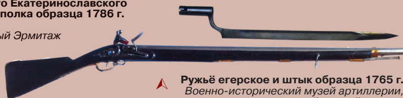
▲ Ружьё егерское и штык образца 1765 г. Военно-исторический музей артиллерии, инженерных войск и войск связи

Рейтар лейб-гвардии Конного полка в проектных мундирах конца 1780-х гг. Акварельный рисунок неизвестного художника. Российский государственный военно-исторический архив