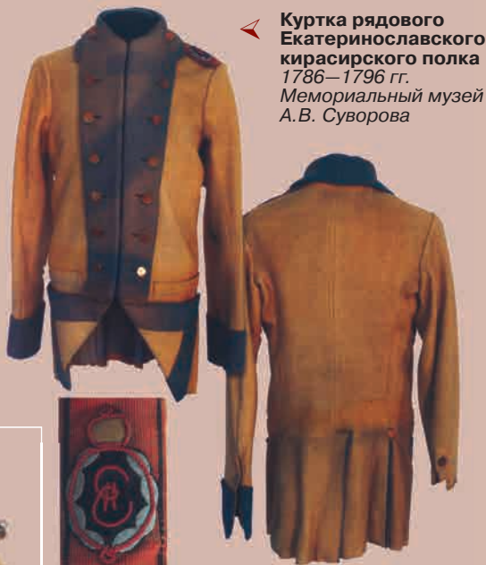
▲ Куртка рядового Екатеринославского кирасирского полка 1786—1796 гг. Мемориальный музей А.В. Суворова