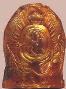
Шапка бомбардира Бомбардирского полка Артиллерийского корпуса

Художник В.Л. Боровиковский. 1795 г. Государственный музей-заповедник «Павловск»