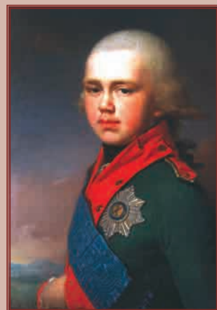
Великий князь Константин Павлович

Художник Н.И. Аргунов. 1812 г. Государственная Третьяковская галерея