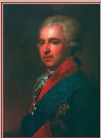
С.Ф. Голицын. Аdjутант изображён в вицмундире пехотного генерал-поручика с шитьём флигель-адъютанта свиты Её императорского величества.