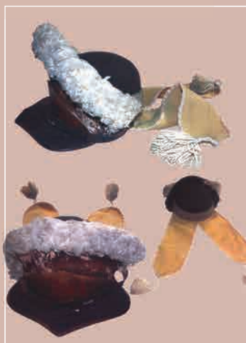
▲ Каска рядового Екатеринославского кирасирского полка образца 1786 г. 1786—1796 гг. Государственный Эрмитаж