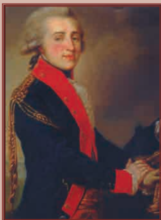
А.И. Лазарев. Изображён в мундире генерал-адъютанта, состоящего по кавалерии.

Художник Ж.Б. Лампи-старший. 1792—1797 гг.