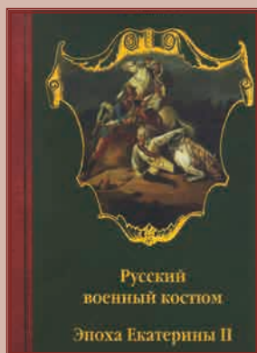
▲ Обложка книги