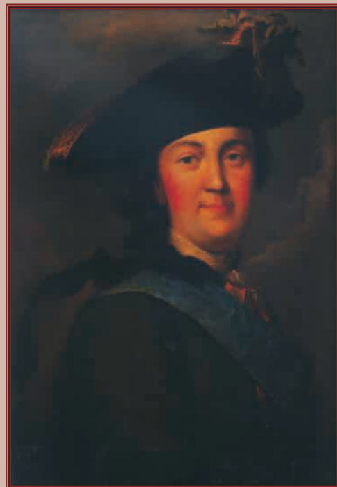
▲ Екатерина II Алексеевна С портрета В. Эрикссена. 1762 г. Государственный Русский музей