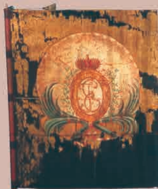
Вальтрап полного генерала по кавалерии, состоящего по легкоконным полкам

1783—1796 гг. Государственный исторический музей