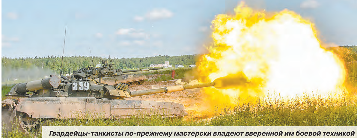
Гвардейцы-танкисты по-прежнему мастерски владеют вверенной им боевой техникой

Прославленному соединению Вооружённых Сил страны – гвардейской танковой Кантемировской ордена Ленина Краснознамённой дивизии имени Ю.В. Андропова – исполнилось 78 лет. Годовщину создания военнослужащие отметили масштабным учением.