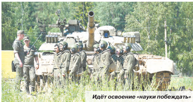
Идёт освоение «науки побеждать»

Прославленному соединению Вооружённых Сил страны – гвардейской танковой Кантемировской ордена Ленина Краснознамённой дивизии имени Ю.В. Андропова – исполнилось 78 лет. Годовщину создания военнослужащие отметили масштабным учением.