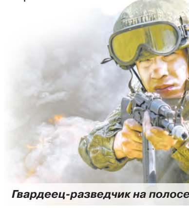
Гвардеец-разведчик на полосе препятствий