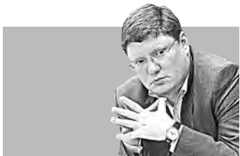
Андрей Исаев председатель Комитета Госдумы по труду, социальной политике и делам ветеранов