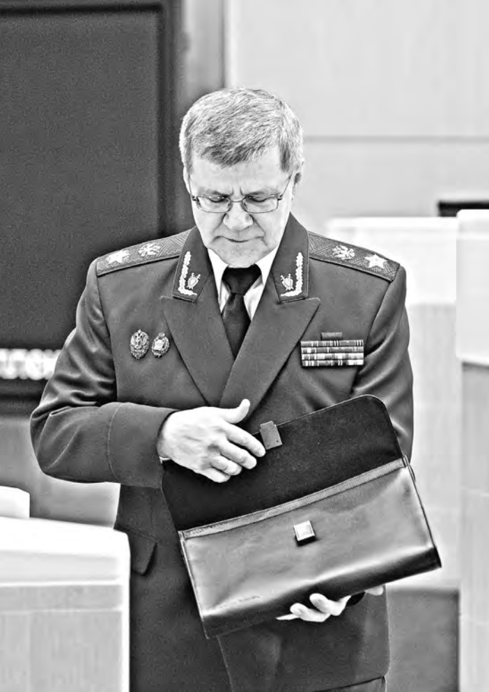
В папке Юрия Чайки оказалось немало предложений законодателями.

суррогатного алкоголя, усилив ответственность за его производство и хранение», — заявил Генпрокурор. Он, правда, не уточнил степень ответственности, которую следовало бы вводить за подобные преступления.