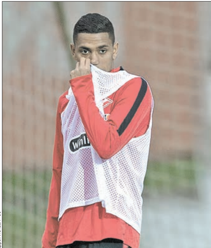
Полузащитник «Спартак» ПЕДРО РОША.