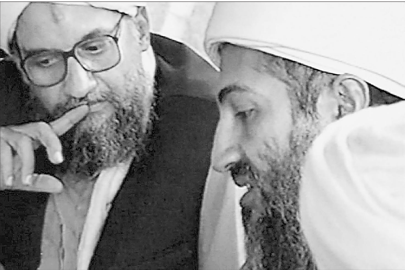
Террорист № 1 Осам бен Ладен (справа) и его ближайший помощник Айман аль-Завахири, которого 5 лет назад сотрудники ФСБ задерживали в Дагестане