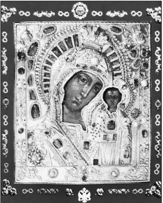
Ватиканская икона Казанской Божией Матери — настоящая. Ватикане, является подлинной и была объектом богослужения и особого почитания.

— Каким все же было заключение экспертной комиссии? — Комиссия пришла к заключению, что икона, хранящаяся в