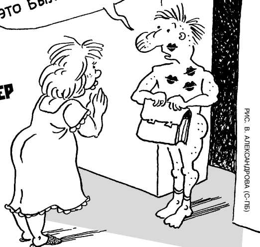
РИС. В. АЛЕКСАНДРОВА (С-ПБ)