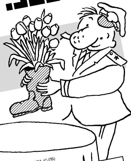
РИС. В. АЛЕКСАНДРОВА (С-ПБ)

МУЖ БРОСИЛ ЖЕНУ С ДВУМЯ МАЛЕНЬКИМИ ТИТЬКАМИ!