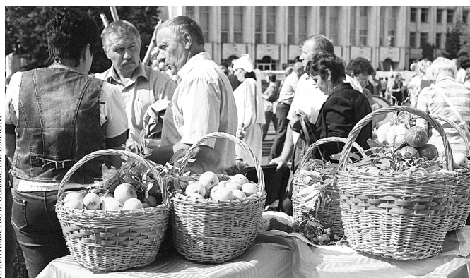
ПРАВИТЕЛЬСТВО ЯРОСЛАВСКОЙ ОБЛАСТИ