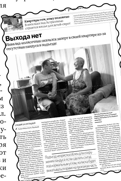
Выхода нет Инвалид-колясочник оказался заперт в своей квартире из-за отсутствия пандуса в подъезде

помещение с учетом потребностей инвалида возможно. Правда, стоимость работ оценили в 456 800 рублей. После чего администрация стала настаивать на проведении общего собрания жильцов, дабы они скинулись на пандус для соседа — ведь не в компетенции управляющей компании