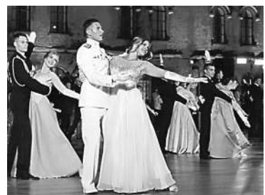
Севастополь — город русских моряков.

8 ноября жених и невеста должны подать заявление на регистрацию брака. А сама регистрация состоится 15 декабря, в день Севастополя на выставке-форуме «Россия». Кстати, правительство Севастополя оплатит проезд и проживание молодой пары, родителей и свидетелей, а также фото- и видеосъемку торжественного события.