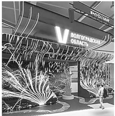
Волгоград покажет инсталляцию «Свет великой Победы».

Тут же — видеoinсталляция «Свет великой Победы» — ее проецируют на копию памятника. А еще прямо на ВДНХ можно совершить VR-экскурсию по Мамаеву кургану и музею-панораме, планетарию и «Старой Сарепте», «Волгоград-арене» и центральной набережной.