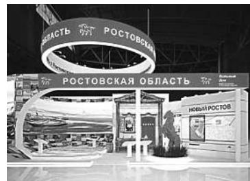
Ростовская область представлена и замечательными победами на полях, и казачьим колоритом.

В дизайне используют элементы традиционной местной архитектуры, в том числе резные оконные наличники. Поэтому даже сам стенд будет напоминать о донских обычаях.