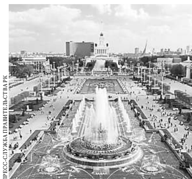
Калмыкия: древность и современность.

Каждый может покрутить молитвенный барабан — кюрдэ, что приравнивается к прочтению сотен тысяч молитв, и поиграть на национальных музыкальных инструментах.