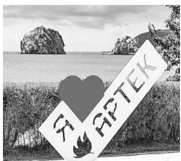
Лавандовые поля, горы и море — визитная карточка Крыма.