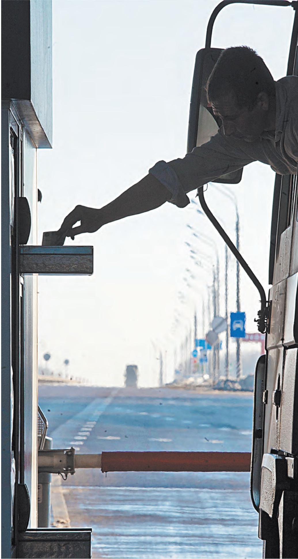
Когда на ЦКАД и других трассах запустят систему безбарьерной оплаты, автомобили будут ехать без остановки.

2,5 РУБЛЯ за километр стоит проезд по платным трассам для владельцев транспондеров