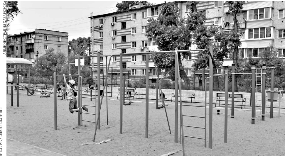
Современные площадки для игр и занятий спортом преобразуют хабаровские дворы.