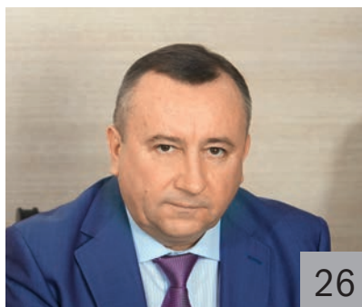
В. Ф. БОРОВИК, заместитель губернатора — начальник Департамента финансов и бюджетной политики Белгородской области