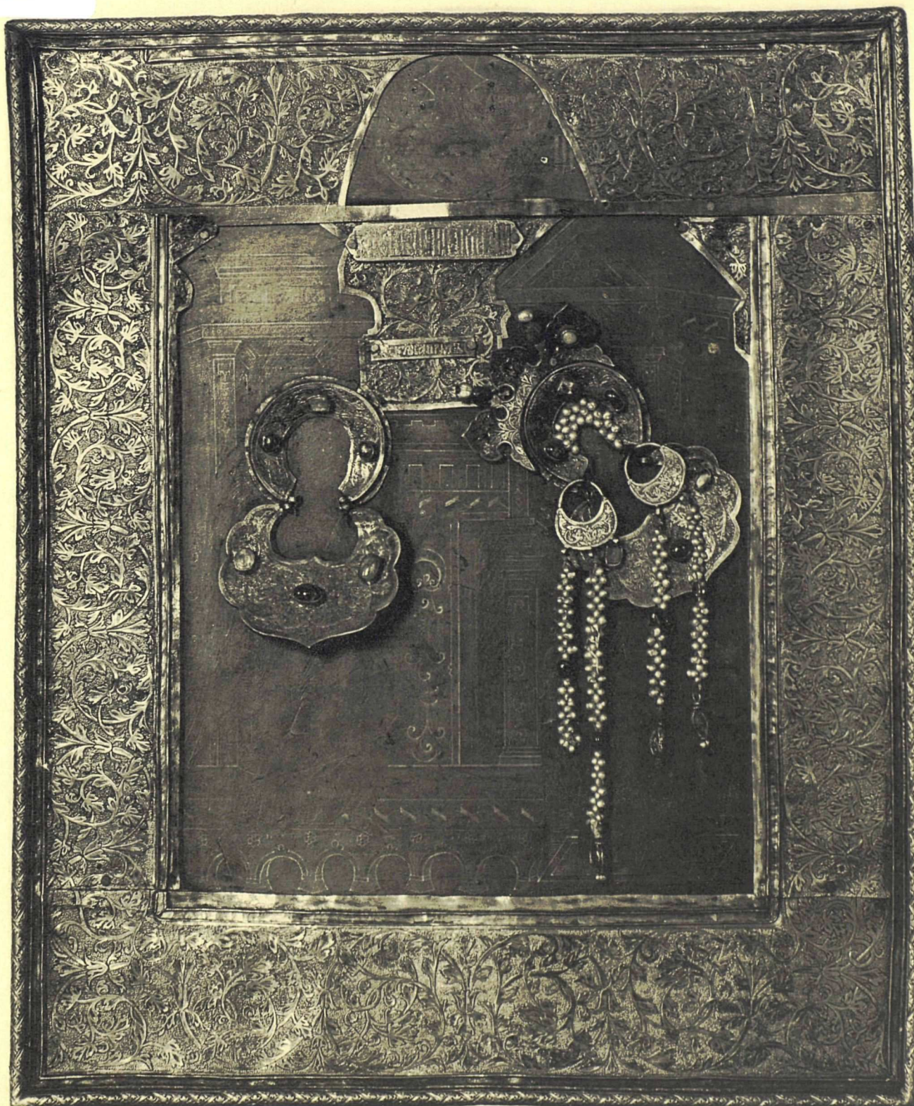
Икона Благовѣщенія Пресвятыя Богородицы (размѣрамъ 6×5 вершковъ). Вкладъ царевны Маріи Алексѣевны въ Симоновъ монастырь.