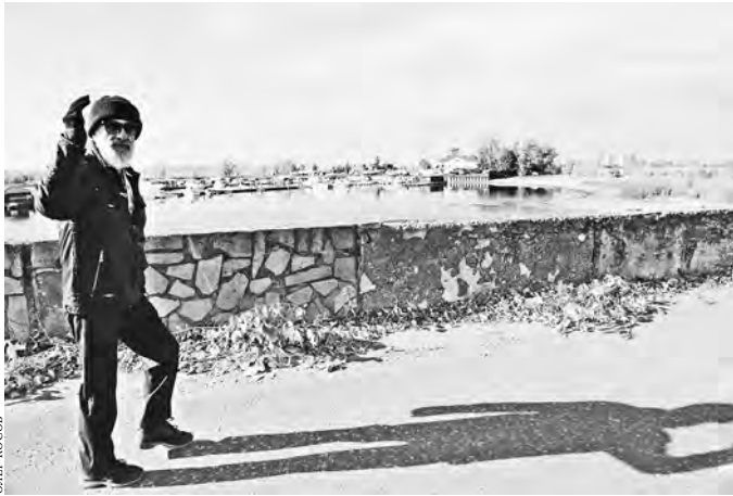
На благоустройство казанской набережной Волги потребуется не меньше двух лет.

Сколько средств потребуется для того, чтобы воплотить задуманное в жизнь, в министр сказать пока затрудняются. Уверены лишь в том, что проект будет выполнен в срок. Александра Курбатова, Казань