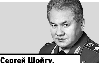
Сергей Шойгу, министр обороны РФ