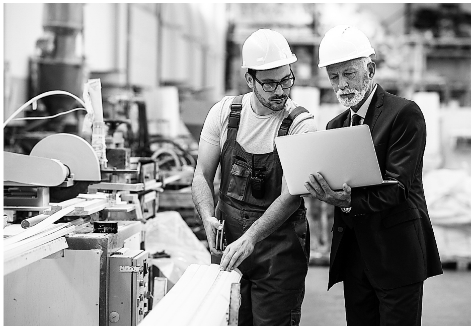
Государственный контроль проводится в ходе инспекционного визита, рейдового осмотра, документарной и выездной проверок

Документ вводит семь видов профилактических мероприятий: информирование, обобщение правоприменительной практики, меры стимулирования