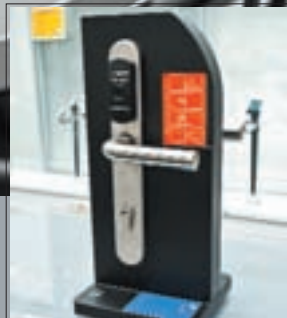
NFC для разной жизни

Подписные индексы: 47743 по каталогу «Роспечать», 40917 по каталогу «Пресса России», 99720 по каталогу «Почта России»