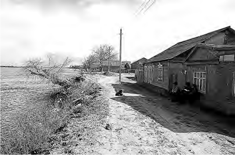
Вода уже почти вплотную подобралась к домам.