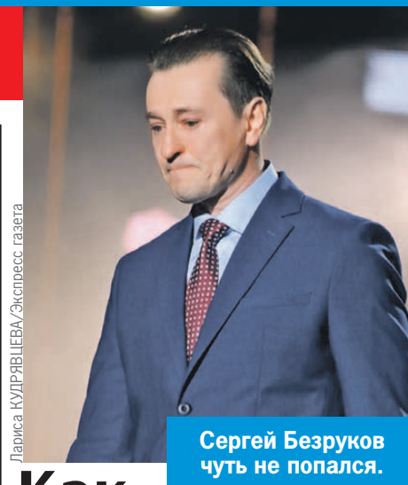
Сергей Безруков чуть не попался.