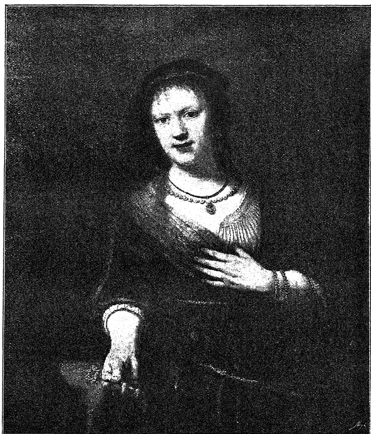
Портрет жены Рембрандта, написанный около 1640 г. (Дрезденская галерея).