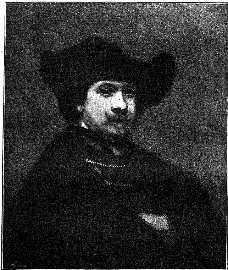
Собственноручный портрет Рембрандта, написанный около 1614 г. (Вуффингамский дворец).