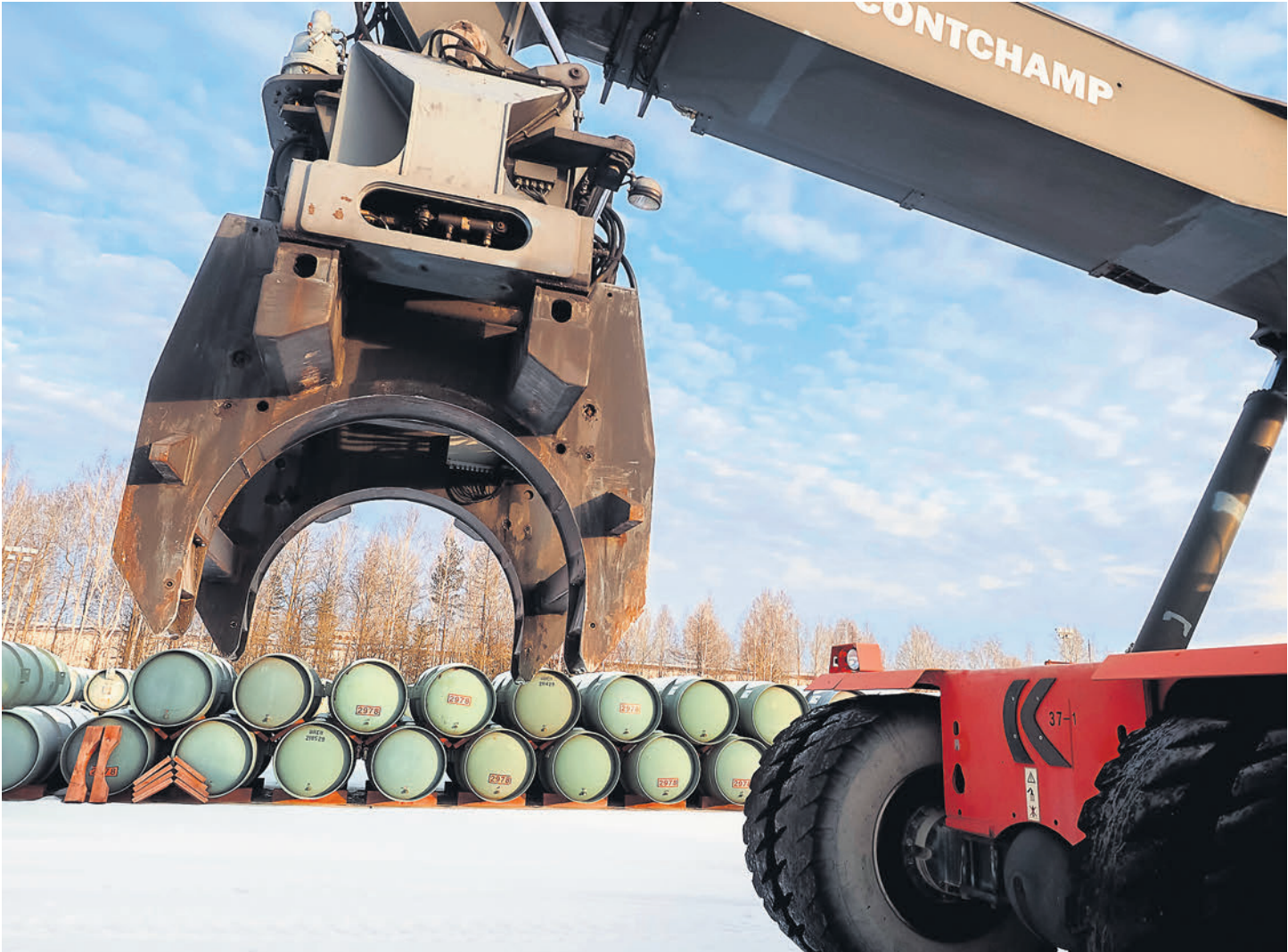
США пока не могут отказаться от российского урана, несмотря на его высокую стоимость

Объем поставок из России, судя по статистике последних лет, существенно зависит от цены, увеличиваясь в периоды низких цен. Один из собеседников «Ъ» в отрасли соглашается, что снижение поставок сырья из РФ в 2022 году может быть связано с графиком поставки в долгосрочных контрактах, а также с рыночными ценами на продукцию, но не обязательно означает сокращение общего объема контрактов. В прошлом году стоимость уранового сырья росла рекордными темпами: для американских потребителей средневзвешенная цена выросла на 15% год к году, до $39,08 за фунт U3O8, что стало максимальным показателем с 2016 года, говорится в отчете