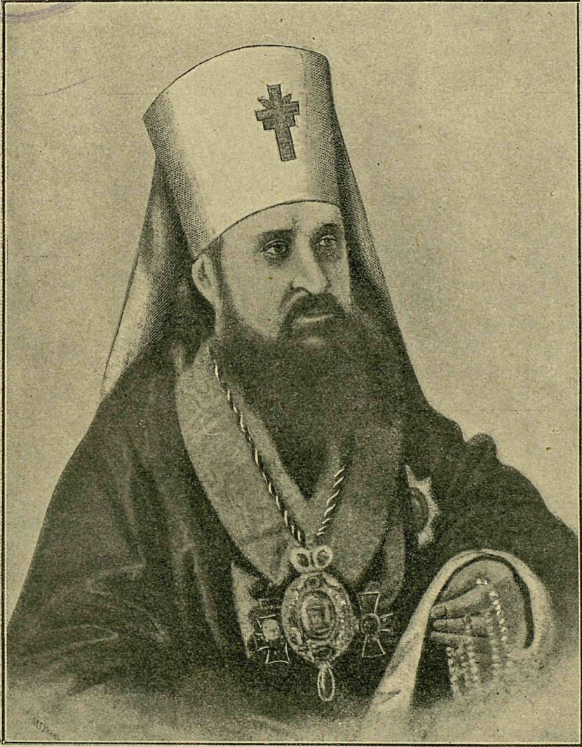
Іосифъ Сѣмашко, митрополитъ литовскій († 23 ноября 1868 г.).