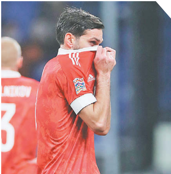
Александр Федоров «СЭ» / Canon EOS-1DX Mark II