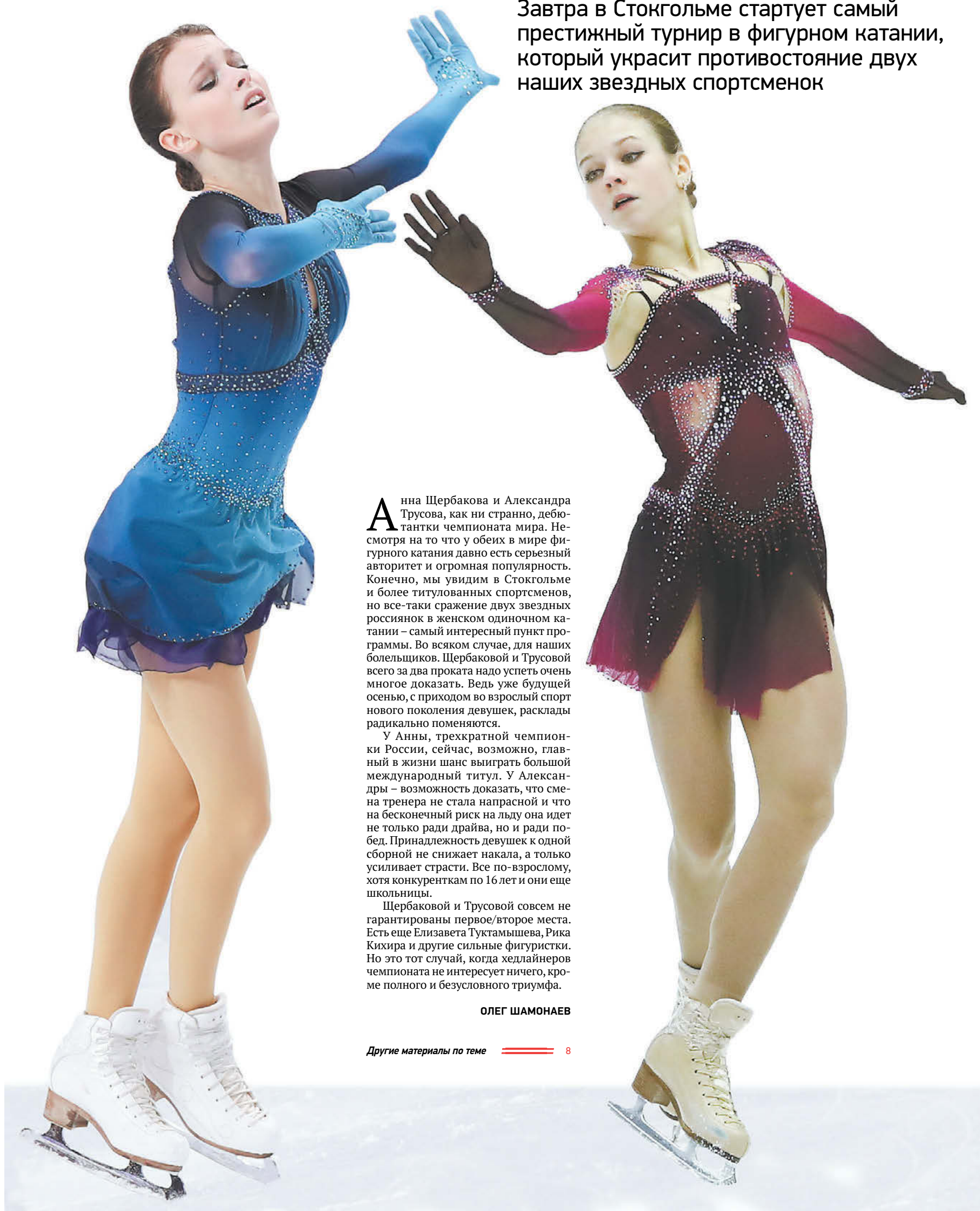
16-летняя Анна Щербакова