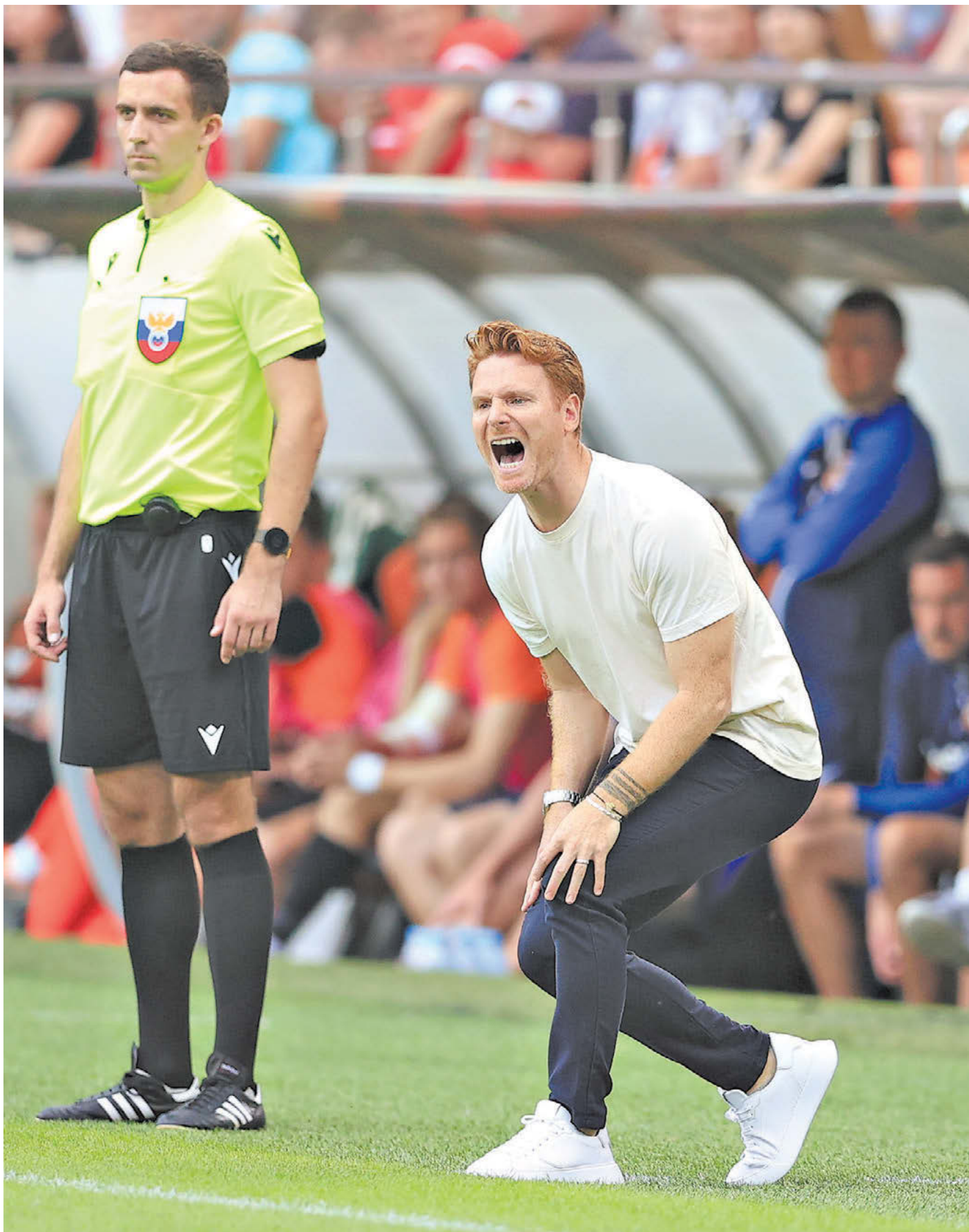
Суббота. Екатеринбург. «Урал» – «Спартак» – 0:2. Главный тренер красно-белых Гильермо Абаскаль продолжает удивлять

После победы над «Уралом» (2:0) красно-белые возглавляют таблицу РПЛ на пару с ЦСКА, который разгромил «Факел» (4:1). Оба клуба на два очка опережают «Зенит», сыгравший вничью в Грозном (0:0). При этом спартаковцы делают это на фоне разговоров о смене высшего менеджмента и продажи домашнего стадиона