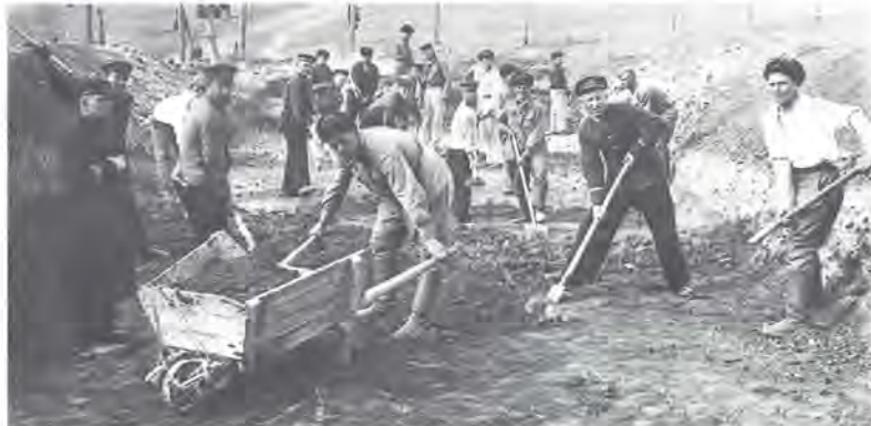
Строительство оборонительных рубежей на подступах к Севастополю.

80 лет назад, 30 октября 1941 года, началась героическая оборона Севастополя, которая стала одним из важнейших событий Великой Отечественной войны