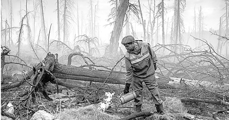
Возможно, ужесточение наказаний научит людей быть осторожными с огнем.

С начала пожароопасного сезона, который в Алтайском крае начался 21 апреля, на землях лесного фонда произошло 178 возгораний, огонь охватил 151,04 гектара. В прошлом году на эту же дату (при начале сезона 16 апреля) цифры были чуть выше — 210 лесных пожаров общей площадью 330,28 гектара.