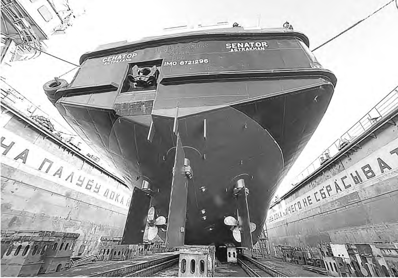
ЮЖНЫЙ ЦЕНТР СУДОСТРОЕНИЯ И СКОПЛЕНИЯ