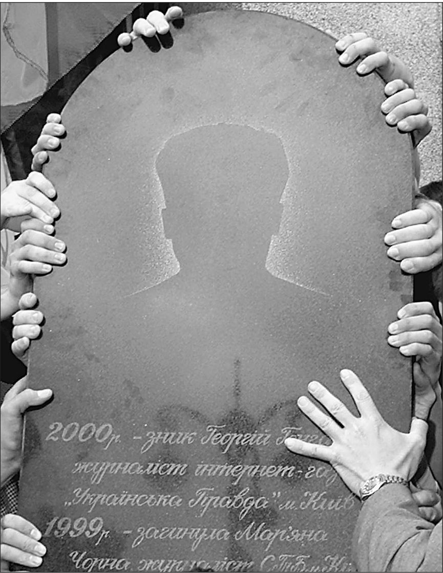
Памятник погибшим украинским журналистам

Что конкретно стоит за этими словами — неизвестно. В Совете безопасности «Известиям» не смогли дать исчерпывающего ответа. Соглашения между Россией и Туркменистаном о выдаче лиц, подозреваемых в совершении преступления, нет. Сейчас, как сообщили в посольстве, Туркмения выступает за разработку и заключение соглашения, по которому лица с двойным гражданством