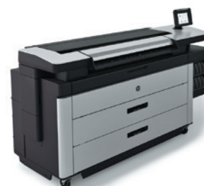
24 HP PAGEWIDE XL 5000 юрий захаржевский