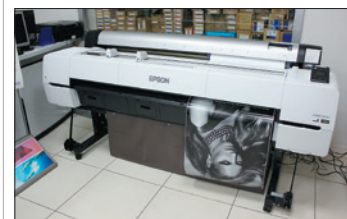
6 EPSON ПРИГОТОВИЛ СМЕНУ