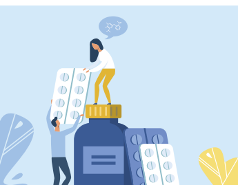
Рисунок на обложке: Shutterstock.com

ОФОРМИТЕ ПОДПИСКУ В СЕНТЯБРЕ, зарегистрируйтесь на сайте rosapteki.ru и получите в подарок 500 баллов на счет Клуба РА