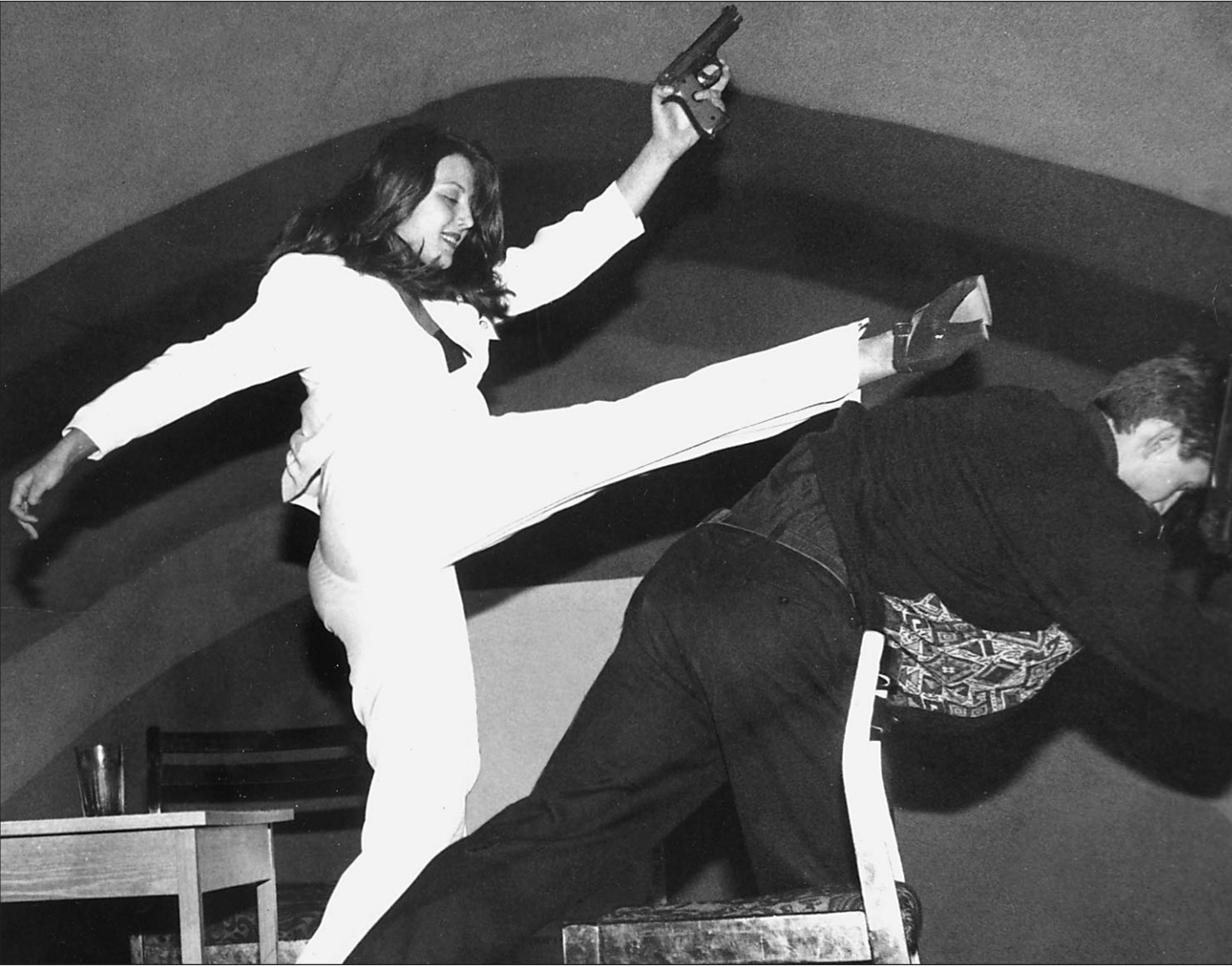
Семейная жизнь часто похожа на войну: бьет — значит любит

Причины того, что жертвы не уходят на все четыре стороны, одни и те же во всем мире. Начиная с банальных экономических: некуда ид-