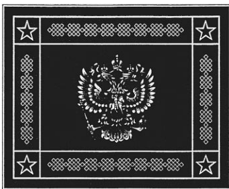
Так будет выглядеть новый флаг Российской армии

зидента и глава Минобороны Сергей Иванов на специальном совещании расширенной коллегии ведомства в ноябре прошлого года: «Звезда для военнослужащих — понятие святое. Со звездой воевали и одерживали победы наши отцы и деды», — вспоминал министр, принимавший парад в День Победы в гражданском костюме. — На на-