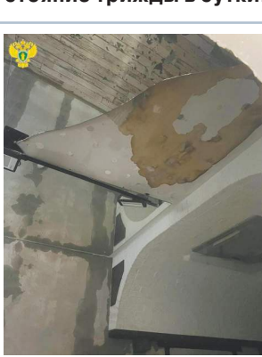
От воды клей размок, поэтому зеркало и упало на женщину.

Родители пострадавших, кстати, напомнили, что обратили внимание на необычный оттенок воды