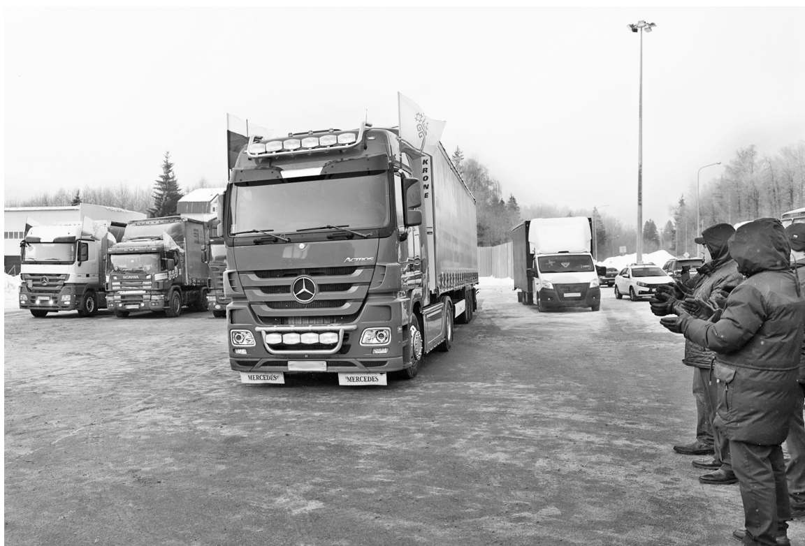
ПРЕСС-СЛУЖБА АДМИНИСТРАЦИИ ГЛАВЫ ЧУВАШСКОЙ РЕСПУБЛИКИ

В зону СВО отправлено не только необходимое оборудование, но и 14 автомобилей