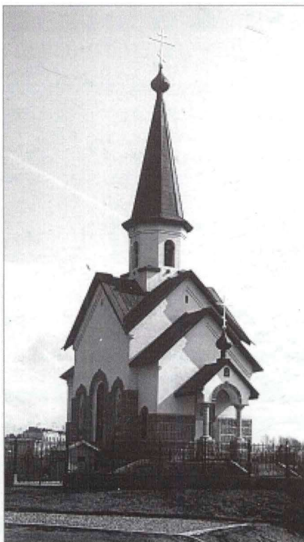
Храм Св. Георгия Победоносца памяти павших на поле брани воинов (Петербург, Средняя Рогатка. Построен и освящен в 1995 г.)