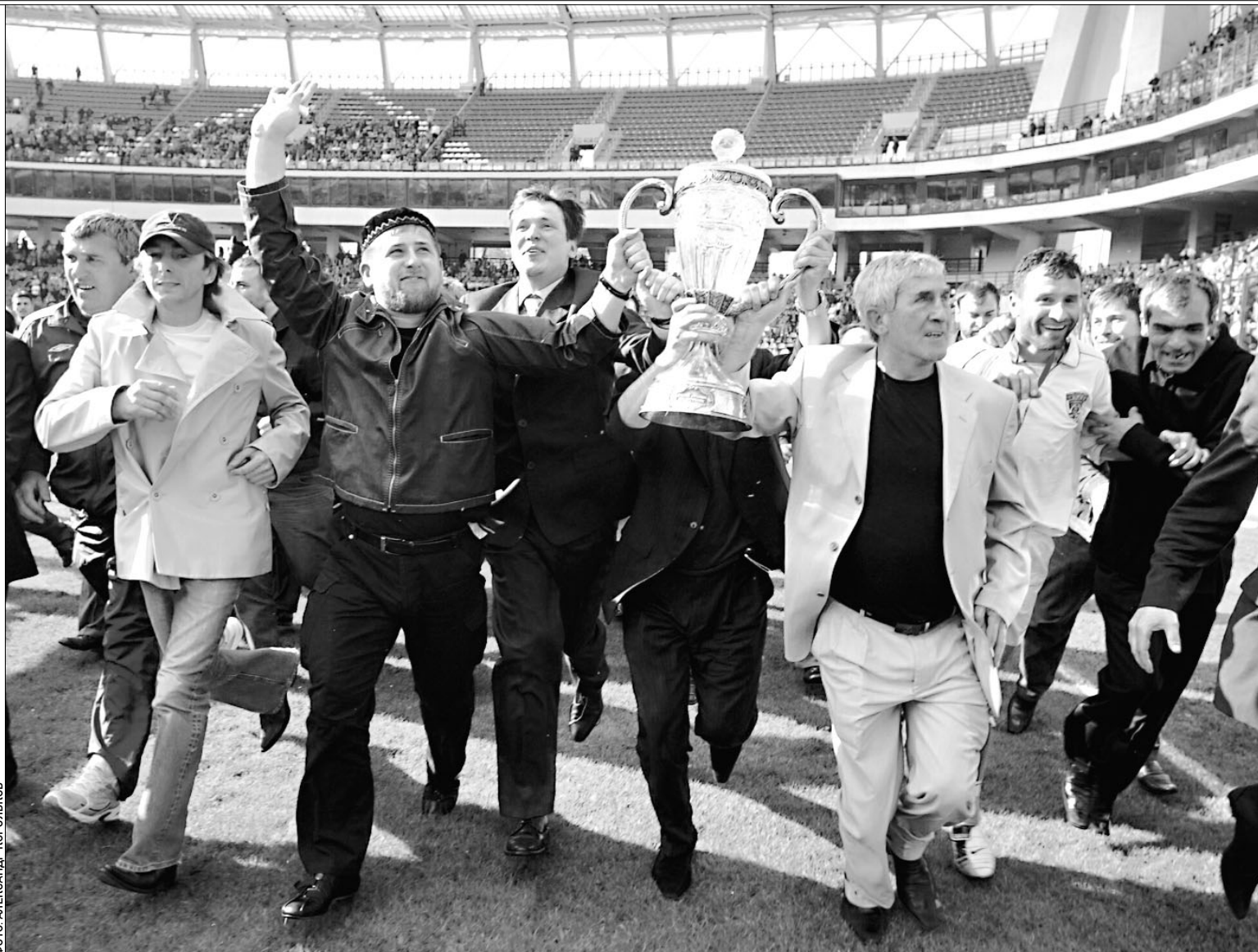
Рамзан Кадыров (слева от кубка) напишет по поводу ситуации с «Тереком» личное письмо Путину

ISSN 0233-4356 РОССИЯ И СНГ цена свободная