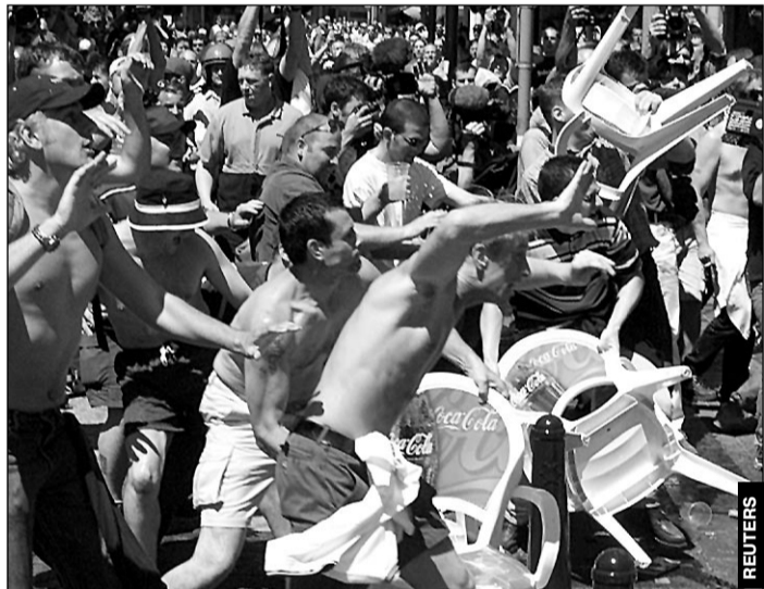
Из-за бесчинств английских фанатов в Брюсселе и Шарлеруа сборную этой страны могут изгнать с Евро-2000.

Подробности матча «Зенит» - «Крылья Советов», интервью с Робсоном и о событиях прошедшего тура - стр. 2 - 3