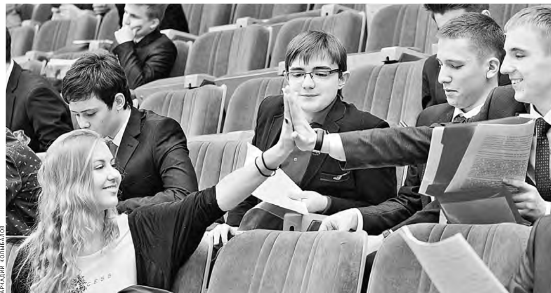
Самые большие льготы дают олимпиады первого уровня.

Все олимпиады разделены на три уровня. Самую большую