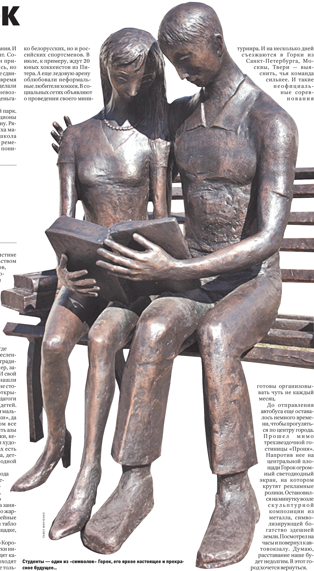
Студенты — один из «символов» Горок, его яркое настоящее и прекрасное будущее...

турнира. И на несколько дней съезжаются в Горки из Санкт-Петербурга, Москвы, Твери — выяснить, чья команда сильнее. И такие неофициальные соревнования