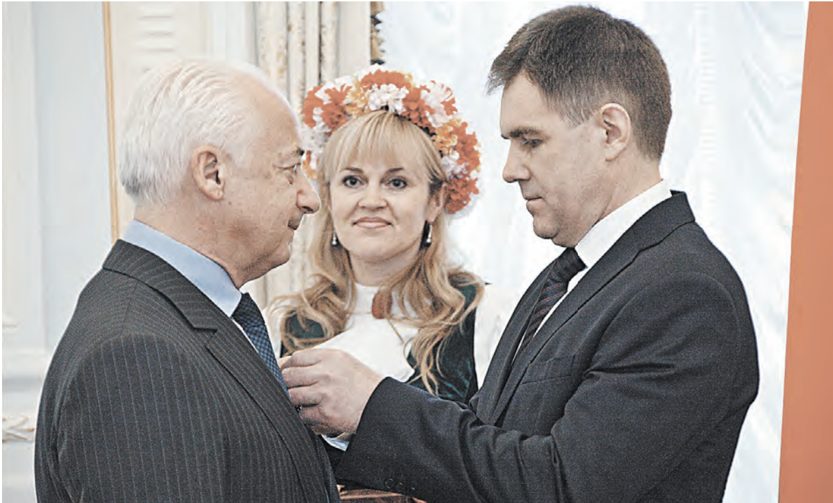
Игорь Петришенко поблагодарил Владимира Спивакова за все сделанное им для Беларуси.