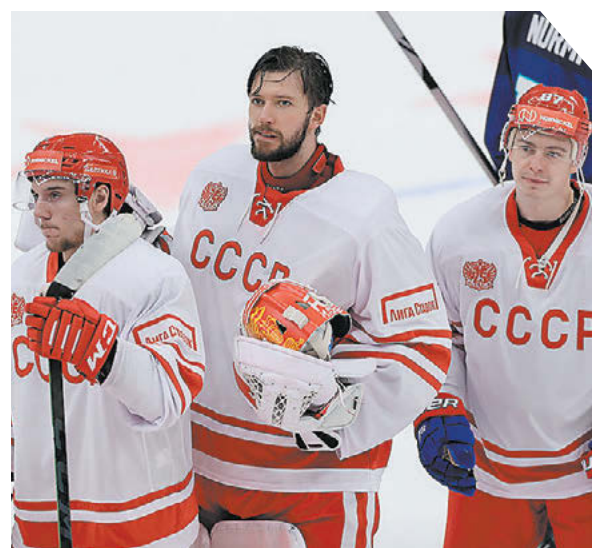
Александр Федоров «СЗ» / Canon EOS-1DX Mark II