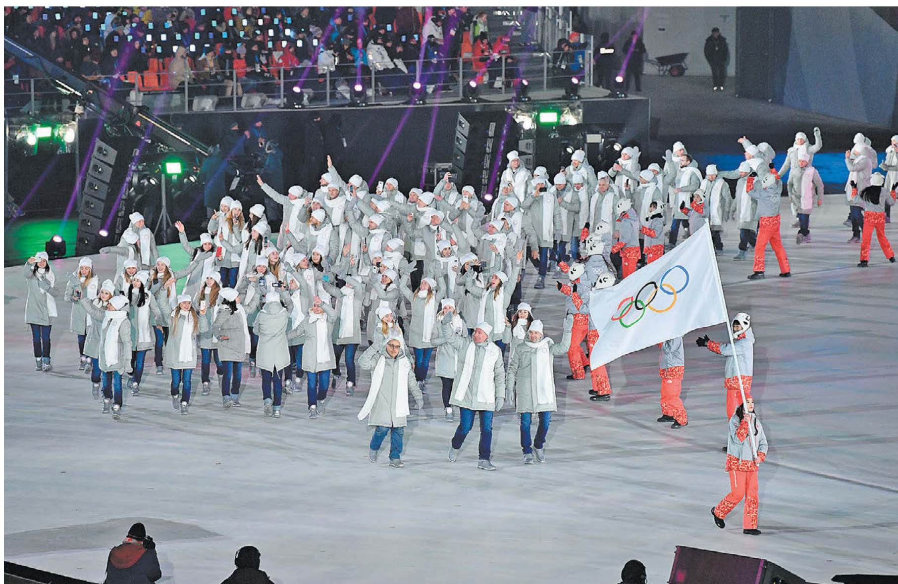
9 февраля 2018 года. Российская делегация на открытии Игр в Пхенчхане

Среди главных тем в преддверии старта Олимпиады в Пекине, помимо ковидных, – кто пойдет во главе колонны ОКР 4 февраля на церемонии открытия Игр