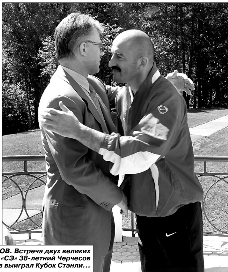
Вячеслав ФЕТИСОВ и Станислав ЧЕРЧЕСОВ. Встреча двух великих игроков. Кстати, вчера в интервью «СЭ» 38-летний Черчесов напомнил, что в 39 лет Фетисов выиграл Кубок Стэнли...