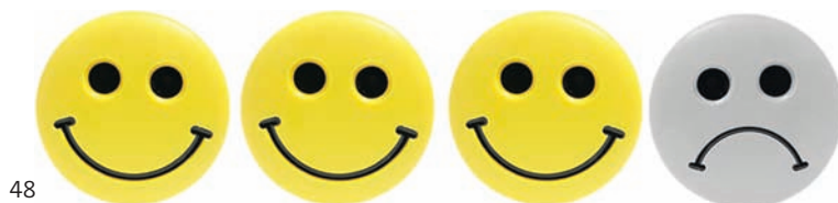
Макет обложки: ZOLOTGroup