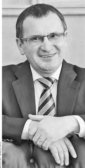
Николай Федоров, Александр Ткачев и Вениамин Кондратьев сдают старые и занимают новые посты.